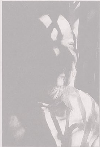
Một tác phẩm trong photo story "Cuộc sống của một nghệ sĩ già".